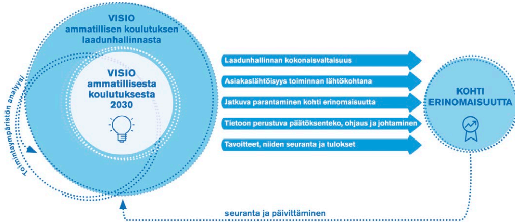
Kuvio 1. Ammatillisen koulutuksen laatustrategian keskeiset elementit ja sisältö.

Ammatillisen koulutuksen toimijoita ovat tahot, jotka vaikuttavat omalla toiminnallaan ammatillisen koulutuksen laatuun ja laadunhallintaan sekä niiden kehittämiseen ja joiden kanssa tuotetaan yhdessä koulutuspalveluja. Alla olevassa kuvassa on esitetty näiden toimijoiden keskeiset roolit ja tehtävät. Ammatillista koulutusta toteutetaan yhä useammin erilaisissa kumppanuus- ja yhteistyöverkostoissa, joihin kuuluu myös muita kumppaneita ja sidosryhmiä.