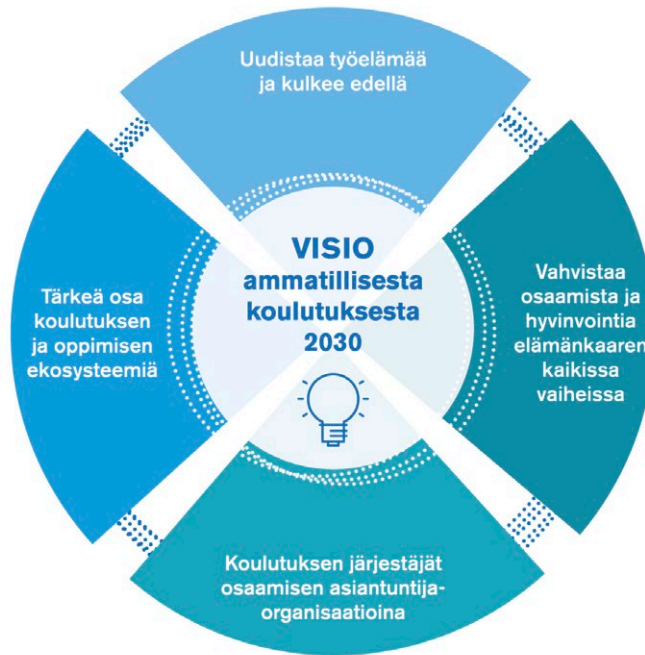
Kuvio 4. Ammatillisen koulutuksen visio vuoteen 2030