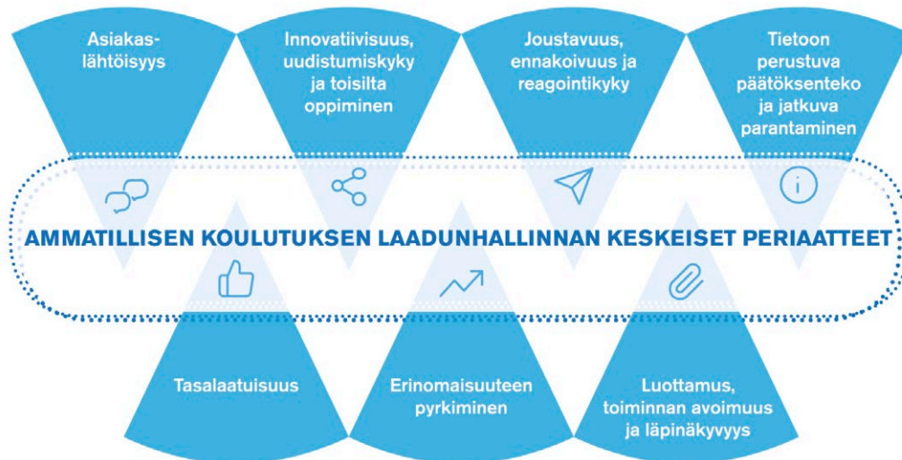
Kuvio 5. Ammatillisen koulutuksen laadunhallinnan keskeiset periaatteet

Ammatillisen koulutuksen laadunhallinnan keskeiset periaatteet on esitetty kuviossa 5 ja laadunhallinnan vision taustalla olevat asiat liitteessä 3.